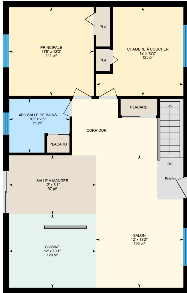
Main Floor Superficie extérieure 1026.36 pi²

Bâtiment principal: Superficie extérieure au-dessus du niveau du sol totale 1026.36 pi²